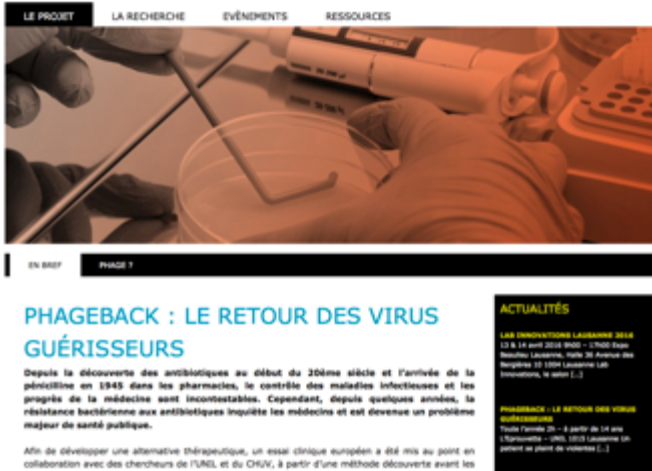
Un site web : www.phageback.ch