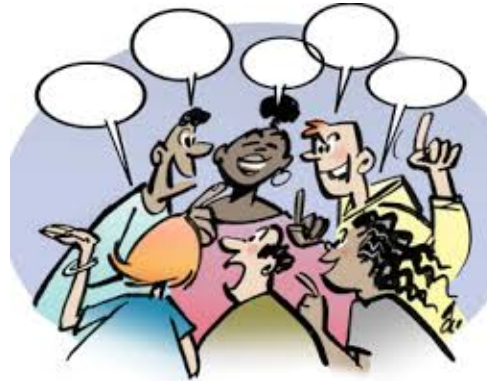
Des ateliers débats