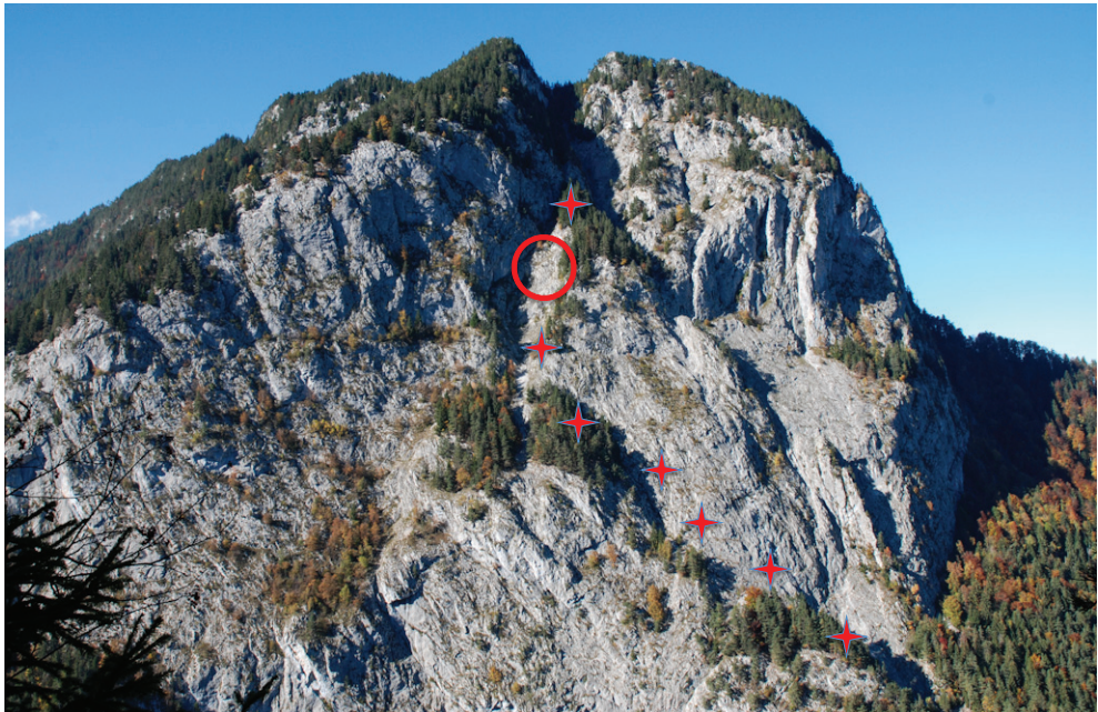
Abb. 3. Simmenfluh, von der Burgfluh aus gesehen. Der rote Kreis markiert den Fundort von Antaxius pedestris auf 1070 m Höhe. Entlang des Aufstiegs (rote Kreuze) finden sich im Fels Chorthippus biguttulus (Linnaeus, 1758), Oedipoda germanica (Latreille, 1804) und Platycleis albopunctata (Goeze, 1778), in den Wäldchen Nemobius sylvestris (Bosc, 1792) und Pholidoptera griseoaptera (De Geer, 1773).

auf einer Höhe von 1070 m auf ein Weibchen der Atlantischen Bergschrecke Antaxius pedestris (Fabricius, 1787). Nach längerem Suchen fand ich zwei weitere Weibchen. Sie waren ein wenig kleiner als Tiere auf der Alpensüdseite. Wegen der Steilheit und Exponiertheit des Geländes konnte ich lediglich etwa 250 m 2 absuchen. Der Lebensraum ist eine südlich ausgerichtete Felspartie mit Grasbüscheln und einigen Sträuchern. Häufigste Begleitarten sind Chorthippus biguttulus (Linnaeus, 1758)