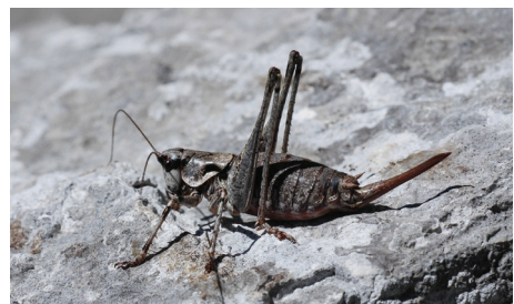
Abb. 1. Das erste in der Simmenfluh gefundene Weibchen von Antaxius pedestris (Fabricius, 1787).

Die Simmenfluh steht als östlichster Ausläufer der Stockhornkette am Eingang zum Simmental bei Wimmis. Der markante Kalksteinberg erhebt sich von 600 bis 1400 m Höhe. Im untersten Teil wächst ein Buchen-Föhrenwald, die darüber aufragende Felswand ist zum grössten Teil kahl und nur an wenigen Stellen von Sträuchern, einzelnen Laubbäumen und kleinen Föhrenwäldchen besiedelt. Aufgrund der Unzugänglichkeit wird das Gebiet forstwirtschaftlich nur wenig genutzt. Ein aufgegebener Steinbruch am Fusse der grossen Schutthalde zeugt von früherem Kiesabbau. Die südöstlich ausgerichtete Bergflanke erhält sehr viel Sonne und bietet für wärmeliebende Insekten günstige Lebensbedingungen. Mit einem Mosaik aus verschiedenen Kleinlebensräumen zeichnet sie sich durch eine grosse Biodiversität aus. So weist Wymann (2010) im verlassenen Steinbruch am Fusse der Wand eine ausserordentliche Vielfalt von Tagfaltern nach.