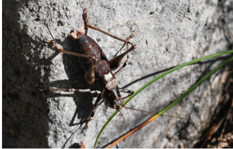
Abb. 2. Ein Männchen von Antaxius pedestris (Fabricius, 1787) wärmt sich an einem Herbsttag in der Morgensonne.

Die Südostwand der Simmenfluh kann auf einem exponierten, z. T. mit Stahlseilen gesicherten Bergweg durchstiegen werden. Bereits im Jahre 1992 entdeckte Christian Roesti (pers. Mitt.) beim Einstieg zur Felswand und auch noch weiter oben die Rotflügelige Ödlandschrecke Oedipoda germanica (Latreille, 1804), eine Art, die nur an wärmebegünstigten Stellen der Schweiz vorkommt und typischerweise einen grossen Anteil Fels im Lebensraum bevorzugt (Baur & Roesti 2006). Diese Beobachtung zeigt die besonders günstigen Verhältnisse für xerothermophile Heuschrecken an dieser Bergflanke. Die neueste Entdeckung macht dies noch deutlicher. Durch Zufall stiess ich während einer meiner zahlreichen Besteigungen am 23. September 2013