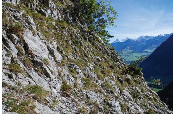
Abb. 4. Lebensraum von Antaxius pedestris (Fabricius, 1787) in der Simmenfluh, zusammen mit Chorthippus biguttulus (Linnaeus, 1758) und Oedipoda germanica (Latreille, 1804). Im Hintergrund Eiger, Mönch und Jungfrau.

Das Vorkommen von Antaxius pedestris in der Simmenfluh ist aussergewöhnlich. Die wärmebedürftige Art ist zentral- und westeuropäisch verbreitet. In der Schweiz kommt sie nur auf der Alpensüdseite, im Wallis und an wärmebegünstigten Stellen im Kanton Graubünden vor (CSCF 2014). Das völlig isolierte Vorkommen in der Simmenfluh eingangs Berner Oberland ist erstaunlich, da es durch die Berner Alpen vom Hauptverbreitungsgebiet im