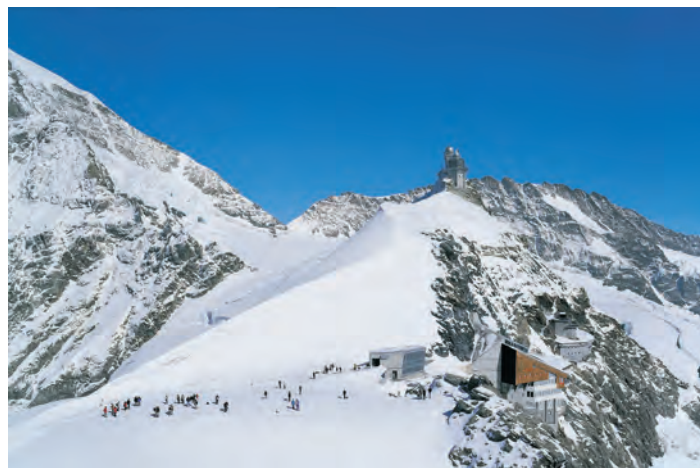
Abb. 1: Touristen auf dem Jungfrauoch Plateau. Im Südhang der Sphinx die Touristenrestaurants, dahinter die 1931 eröffnete Forschungsstation, darüber der Sphinxfelsen mit dem 1937 erstellten, und 1996 erweiterten Observatorium. Hintergrund: Mönch (links) und Eiger.

Wie Guyer-Zeller, der 1899 im Alter von 60 Jahren vor der Vollendung seines Projekts verstarb, sollte auch de Quervain die Eröffnung der Hochalpinen Forschungsstation Jungfrauoch nicht erleben; er starb 1927 im Alter von 48 Jahren an den Folgen eines Schlaganfalls. Der Physiologe und spätere Nobelpreisträger Walter Rudolf Hess führte die von de Quervain begonnene Arbeit als Präsident der Jungfrauoch Kommission weiter, und gründete 1930 die "Internationale Stiftung Hochalpine Forschungsstation Jungfrauoch" (heute: Internationale Stiftung Hochalpine Forschungsstationen Jungfrauoch und Gornergrat, HFSJG, www.hfsjg.ch ). Bereits im Sommer des folgenden Jahres konnte die im Sphinx-Südhang eingebettete Forschungsstation eingeweiht werden. Forschung in alpiner Umgebung, wie sie schon seit einiger Zeit auf Jungfrauoch betrieben worden war 3 , konnte nun in grösserem Stil, und aus einer geeignet eingerichteten, festen Unterkunft heraus, betrieben werden. Sechs Jahre später kam das 120 m höher gelegene Observatorium auf dem Sphinxfelsen dazu. Dort befinden sich heute Messinstrumente von Weltklasse, die insbesondere den Zustand der Atmosphäre mit höchster, dauernd überwachter Genauigkeit erfassen.