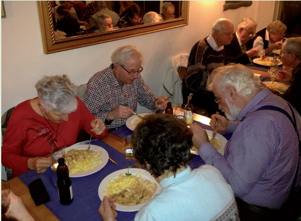
Abb. 3. Nach der Behandlung der Geschäfte der Generalversammlung geniessen die Teilnehmer den verdienten Imbiss.