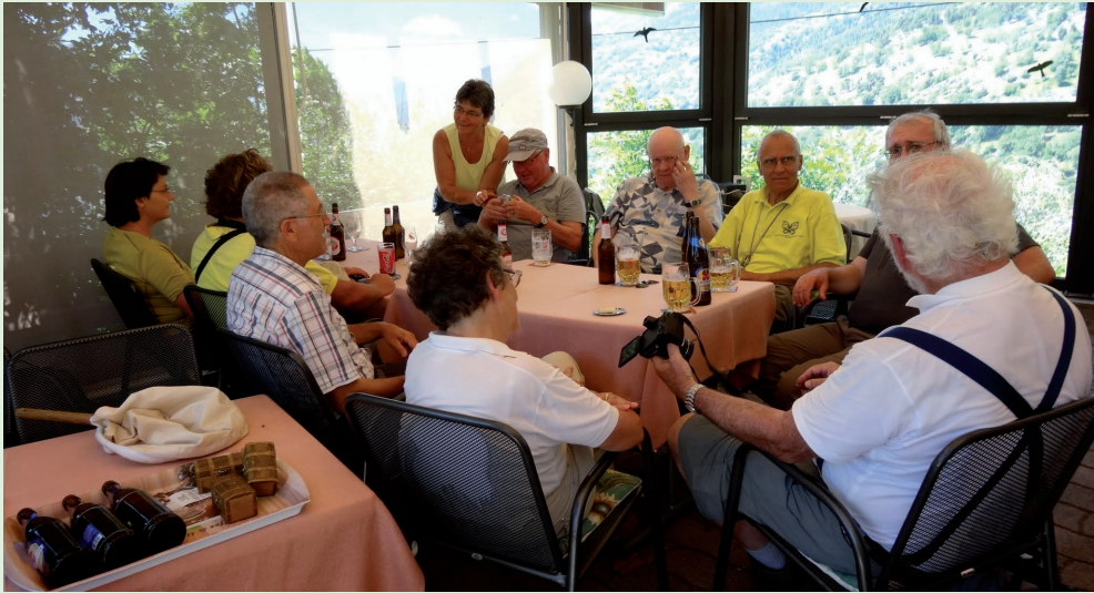
Abb. 2. Entomologie-Tagung im Wallis: Einige Teilnehmer unterhalten sich über das Besondere des Tages.