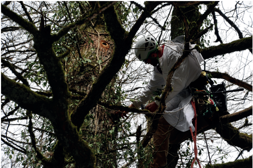
Abb. 1. Hinter dem Spechtloch im Stamm einer Eiche auf 11 Meter Höhe nistet ein Bienenvolk.

Die Häufigkeit der Bienenbaumarten zwischen 5 (Luxemburg) bis 25 (Deutschland) ist allerdings sehr unterschiedlich und variiert je nach Untersuchungsgebiet, die Eichen zwischen 7–50% und die Rotbuche zwischen 14–44%. In Frankreich ist der Anteil der Eichen mit 50% und in Luxemburg mit 38% relativ hoch, ebenso die Rotbuche in Luxemburg mit 44% und in Deutschland zwischen 17 und 30%. Hingegen ist in der Schweiz die Häufigkeit der Bienenbaumarten Eichen und Buchen mit 11–14% nicht ausgeprägt und vergleichbar mit derjenigen der Esche und der Birne.