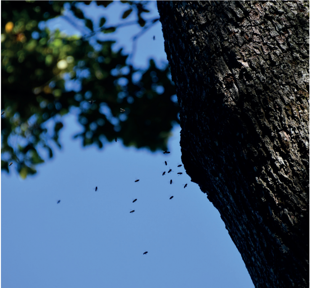
Abb. 4. Flugaktivität von Honigbienen am Flugloch im Stamm einer Eiche im Wald.

Hingegen stimmt die regionale Baumhäufigkeit mit der Häufigkeit der Buche als Bienenbaumart besser überein. Denn in Tieflagen sind Buchenwälder in Deutschland, der Schweiz und Luxemburg verbreitet, wodurch die Rotbuche in den deutschsprachigen und nördlichen Gebieten generell häufiger für Bienen zur Verfügung steht. Anders in Frankreich, wo der Buchenanteil an der gesamten Waldfläche 8 % ausmacht, im Gegensatz zu Deutschland mit 15 % sowie der Schweiz und Luxemburg mit je 21 %.