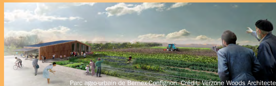
Parc agro-urbain de Bernex-Confignon. Crédit: Verzone Woods Architectes