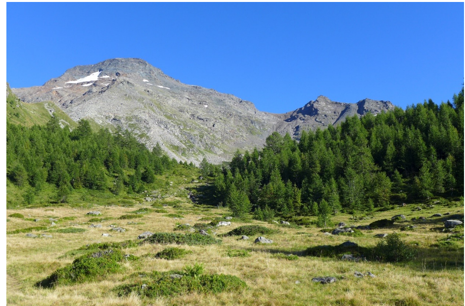
Wasenalp mit Blick auf Wasenhorn (3246 m) am 21.08.2016