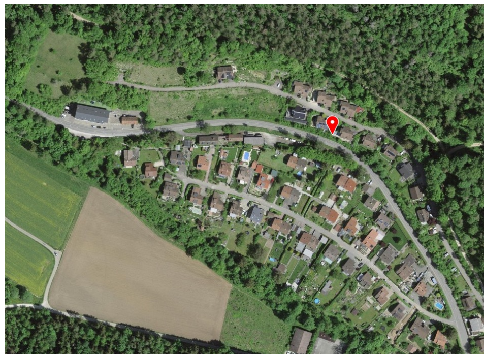
Luftbild (Stand 2024)