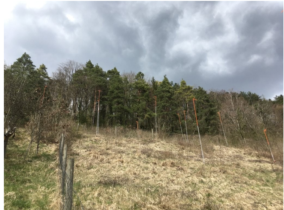
Obere Trockenwiese am 10.04.2022 mit Aussteckung