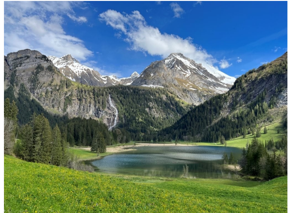
Flachmoor von nationaler Bedeutung am Lauenensee (BE) am 19.05.2024