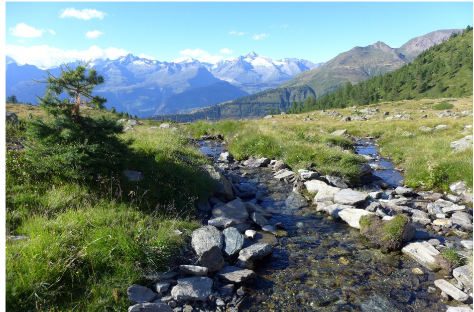
Quellwasser oberhalb Wasenalp am 21.08.2016