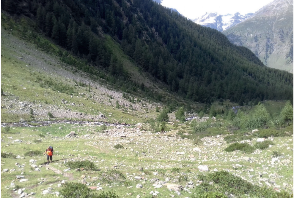
Fig. 2. Lieu de capture d' Amara brunnea dans le Val Zeznina, à proximité du Parc national suisse.

que les élytres), aux angles postérieurs complètement arrondis et par la forme caractéristique de son édéage et du crochet du paramère droit (Fig. 1). En outre, l'absence de fouet à l'origine de la striole scutellaire permet de la distinguer d' A. praetermissa (C. R. Sahlberg, 1827) et sa dent labiale simple (et non bifide) permet de la séparer d' A. bifrons (Gyllenhal, 1810), deux espèces auxquelles elle ressemble.