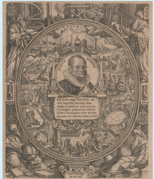
Abbildung: Frontispiz mit dem Porträt von Jost Bürgi, aus: Benjamin Brammer: Apollonius Cattus, Oder: Kern der gantzen Geometrie Kassel 1684. Zentralbibliothek Zürich, Signatur NE 1827: 1