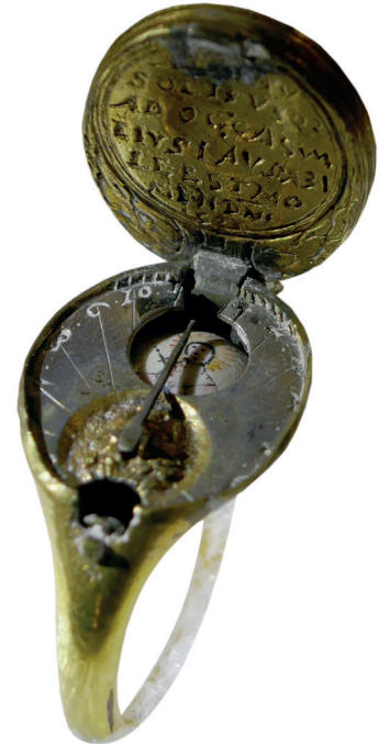
Versteckte Sonnenuhr im Finger-ring des Reformators Heinrich Bullinger, Zürich 1525, Zentralbibliothek Zürich, DEP 403.a

Die Kosmographie des 16. Jahrhunderts verfolgte das Ziel, den Kosmos, also Erde und Himmel, als Ganzes zu verstehen und zu erforschen. In der Ausstellung wird dieses Vor-