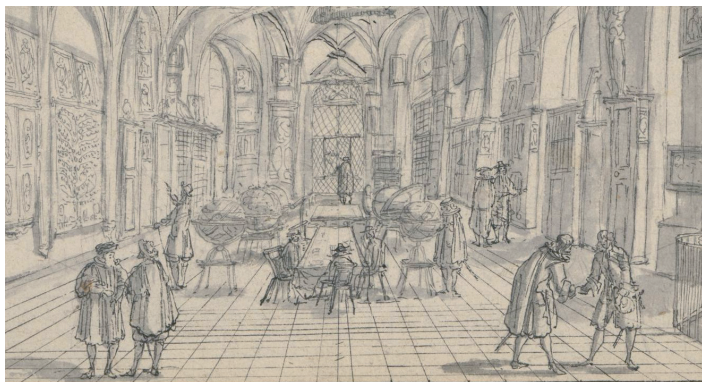
Johann Meyer: Abriss der Kunst-Kammer auf der Wasser Kirchen in Zürich . Entwurf für das Neujahrsblatt der Stadtbibliothek Zürich 1687, Zentralbibliothek Zürich, ZEI Njbl. 22

Die Ausstellungsmacher haben versucht, den Eindruck einer kosmographischen Schatzkammer zu vermitteln. In der frühen Neuzeit wurden an Fürstenhöfen, aber auch in Städten Kunstkammern eingerichtet, in denen Kuriositäten, Präparate, Bücher, Karten und wissenschaftliche Instrumente gesammelt wurden. In Zürich befand sich eine solche Kammer in der Wasserkirche, dem früheren Standort der Stadtbibliothek. Zu jeder dieser Kammern gehörten auch Globen, die den Kosmos, die Welt als Ganzes, in der Kammer repräsentierten.