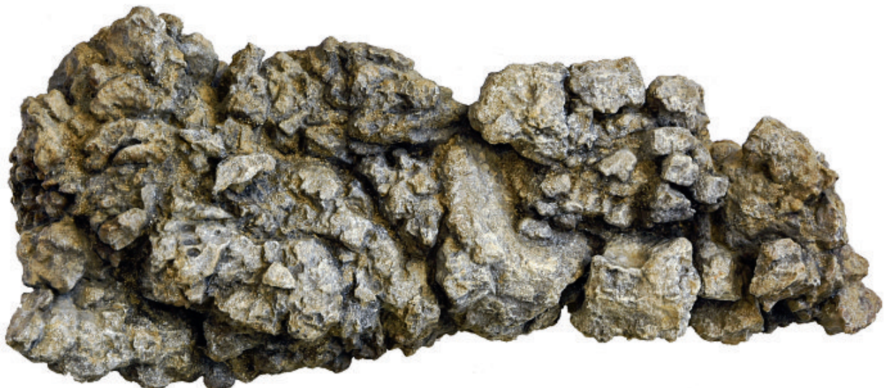
Abb. 2: Koprolith von T. rex (Abguss). Das Original wurde in Kanada gefunden und wird im Royal Saskatchewan Museum in Kanada aufbewahrt. Objektbreite 37 cm.

T. rex ist ein Immigrant (BRUSATTE & CARR 2016). Obwohl mehrere andere Vertreter der Tyrannosaurier in der späteren Kreidezeit den Westen der USA durchstreift hatten, waren sie keine Vorfahren von T. rex . Vielmehr waren asiatische Arten wie Tarbosaurus und Zhuchengtyrannus seine engsten Verwandten. Er begann seine Laufbahn in China oder in der Mongolei, zog über die Bering-Landbrücke, anschliessend durch Alaska und Kanada ins Innere des heutigen Amerika und breitete sich bis New Mexico und Texas aus. Dabei vertrieb er alle anderen mittelgrossen bis grossen Raubdinosaurier. T. rex existierte gerade mal 3 Millionen Jahre lang, vor 68 bis vor 66 Millionen Jahren am Ende der Kreidezeit. Erdgeschichtlich gesehen kurz, denn Dinosaurier traten erstmals vor 235 Millionen Jahren, die ersten Theropoden vor 228 Millionen Jahren auf. Die Überfamilie der Tyrannosauroida, zu der «Rex» zählt, tauchte vor 168 Millio-