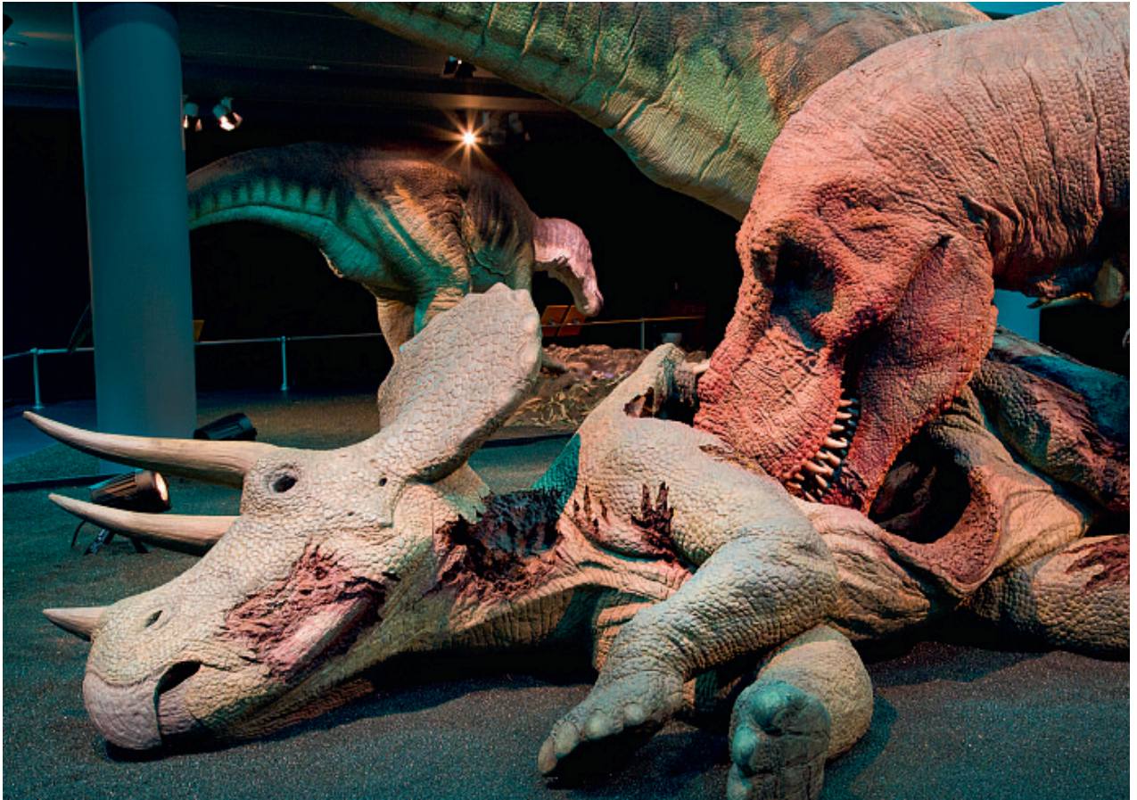
Abb. 6: T. rex tut sich an einem Triceratops -Kadaver götlich.