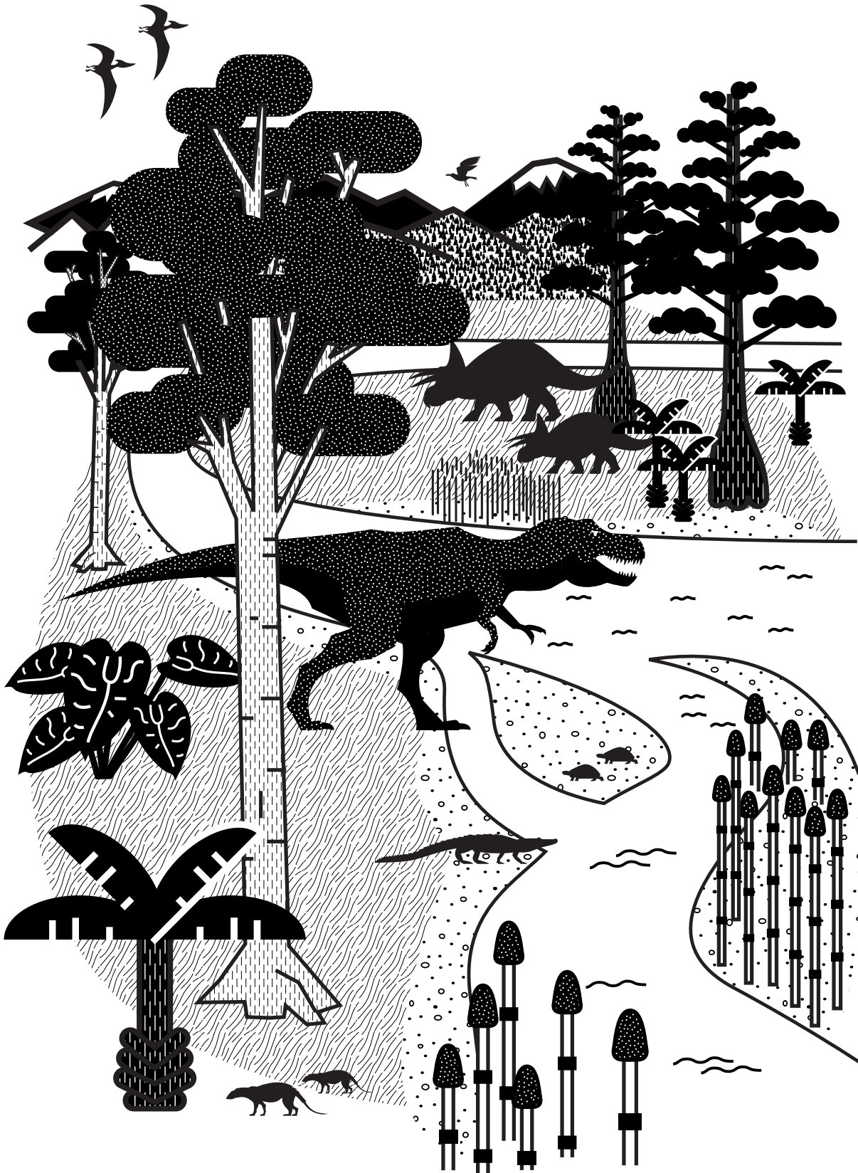
Abb. 1: Rekonstruktion des Lebensraumes von T. rex .