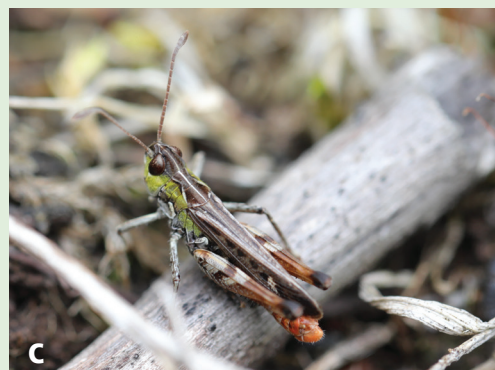
a) Paragus pecchiolii , Nid-du-Crô (NE). (Photo Alain Badstuber), b) Coenonympha arcania , Saint-Blaise (NE). (Photo Sophie Giriens) et c) Myrmeleotettix maculatus , Les Ponts-de-Martel (NE). (Photo Alain Badstuber)