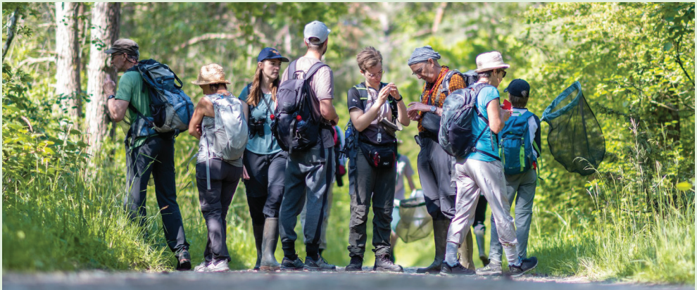
La SFE recherche des Symphytes dans la Grande Cariçaie.