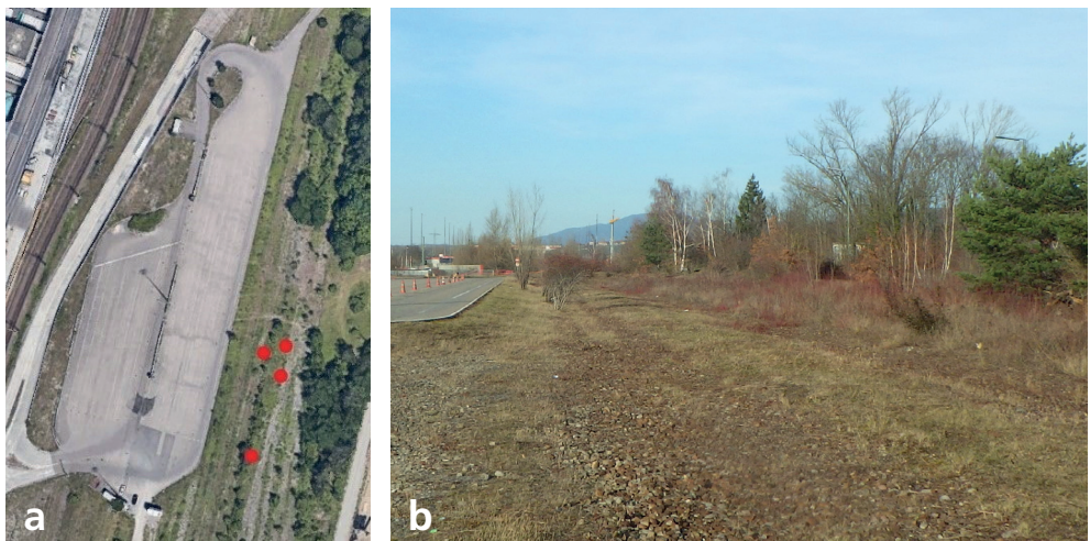
Abb. 3. Fundort (rote Punkte und Lastwagenparkplatz.