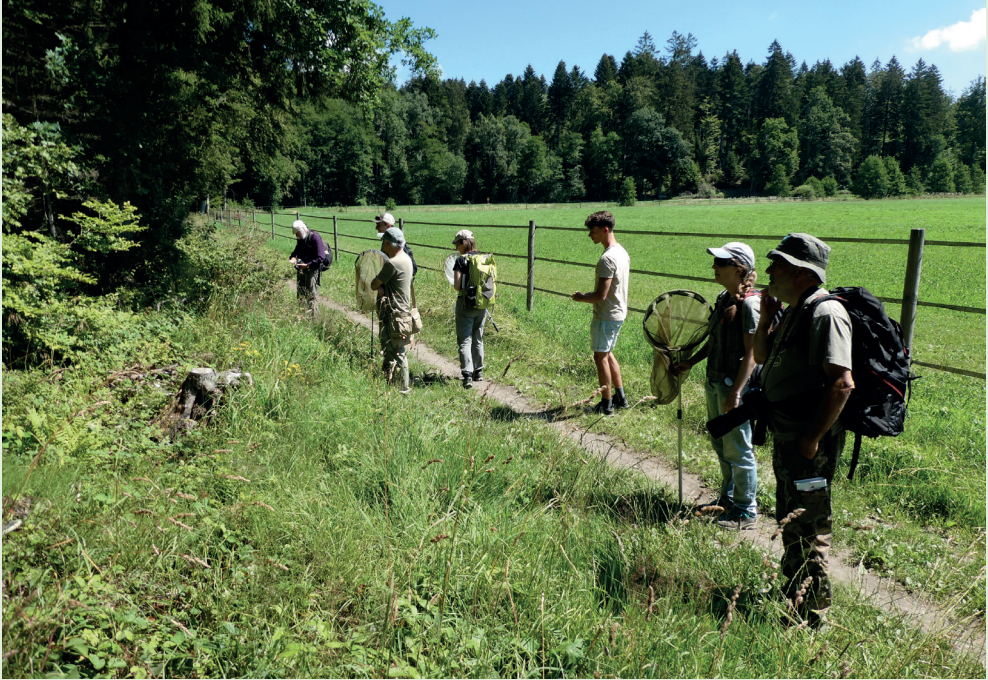
Une lisière ensoleillée et des entomologistes armés de filets : la chasse aux syrphes est lancée.

contributeurs efficaces, récoltant environ un sixième des 6885 échantillons de fourmis, avec une soixantaine d'espèces différentes ! Le projet de poursuivre l'inventaire des fourmis à travers le canton avec les personnes intéressées et de proposer des ateliers de détermination a été mis en veille en 2020 mais sera relancé en 2021.