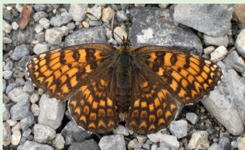
Abb. 5. Ein Weibchen des Flockenblumen-Schneckenfalters Melitaea phoebe wärmt sich am Südhang bei Tschierv.