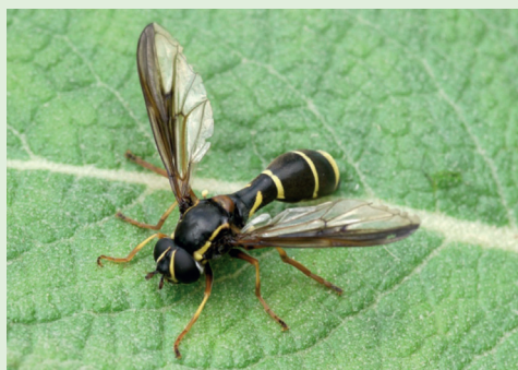
Abb. 2. Die seltene Schwebfliege Doros profuges . (det. Elsa Obrecht)