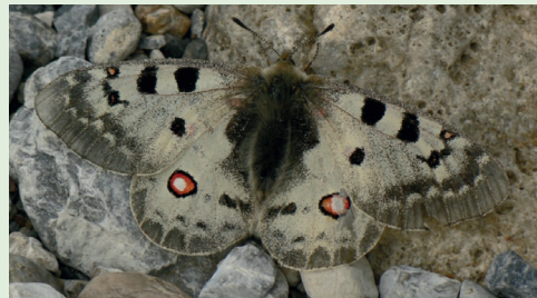
Abb. 8. Der Hochalpenapollo Parnassius phoebus flog in Buffalora am Ofenpass.