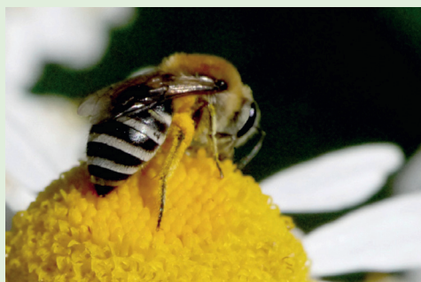
Abb. 1. Die Seidenbiene Colletes similis.