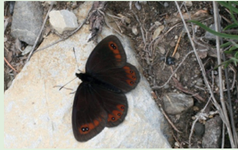
Abb. 6. Erebia styx in ihrem bekannten Habitat bei Tschierv.

Allen Vereinskollegen und -kolleginnen danke ich für die zur Verfügung gestellten Informationen und Bilder.