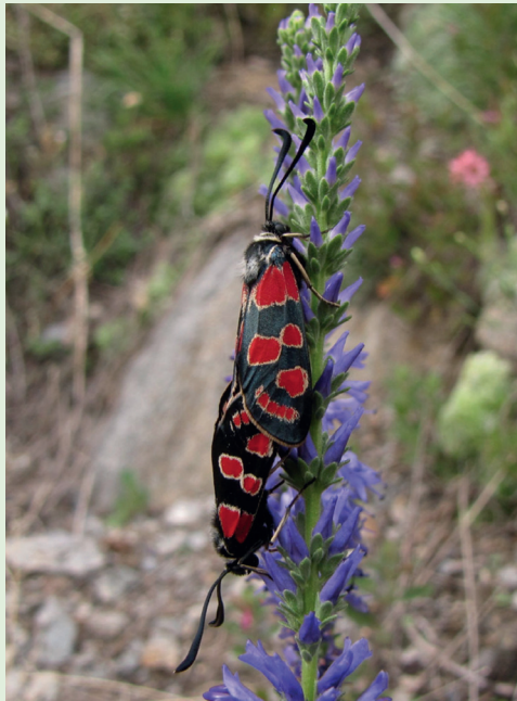
Abb. 4. Wunderschöne Tiere! Kopula des Esparsetten-Widderchens Zyganena carniolica .