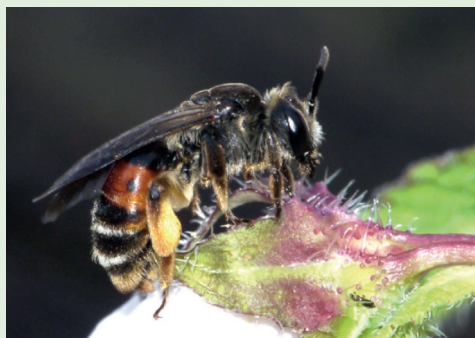
Abb. 3. In Sta. Maria flog die Sandbiene Andrena rufizona .