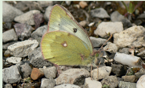
Abb. 7. Colias phicomone in Buffalora am Ofenpass.