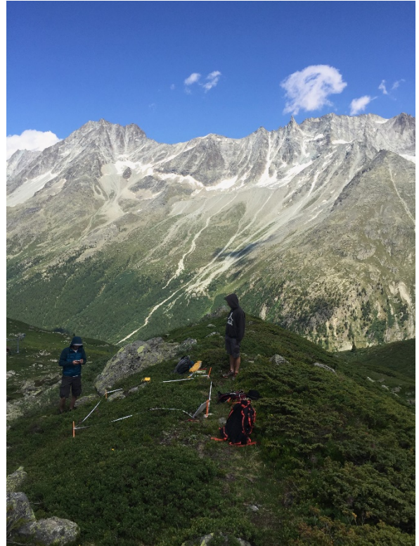
Relevé de végétation au-dessus d'Arolla sur une moraine du Glacier de Tsijiore Nouve en juillet 2019.

Die SBG verfügt über einen Fonds, aus dem kleinere Forschungsvorhaben der alpinen Feldbotanik mitfinanziert werden können. Mitglieder, die vorzugsweise nicht an einer Hochschule oder einem Forschungsinstitut tätig sind, können ein Gesuch um einen Beitrag von maximal 2000 CHF einreichen. In der Regel können Reise-, Aufenthalts- und Materialkosten (teil)finanziert werden. Gesuche (maximal 2 Seiten, mit Autor(en) oder Autorin(nen), Beschreibung des Projekts, kurzem Zeitplan, Verwendung der finanziellen Mittel (Budget) und Angabe der Produkte) sind an den Präsidenten der SBG zu richten. Gesuche werden laufend beurteilt.