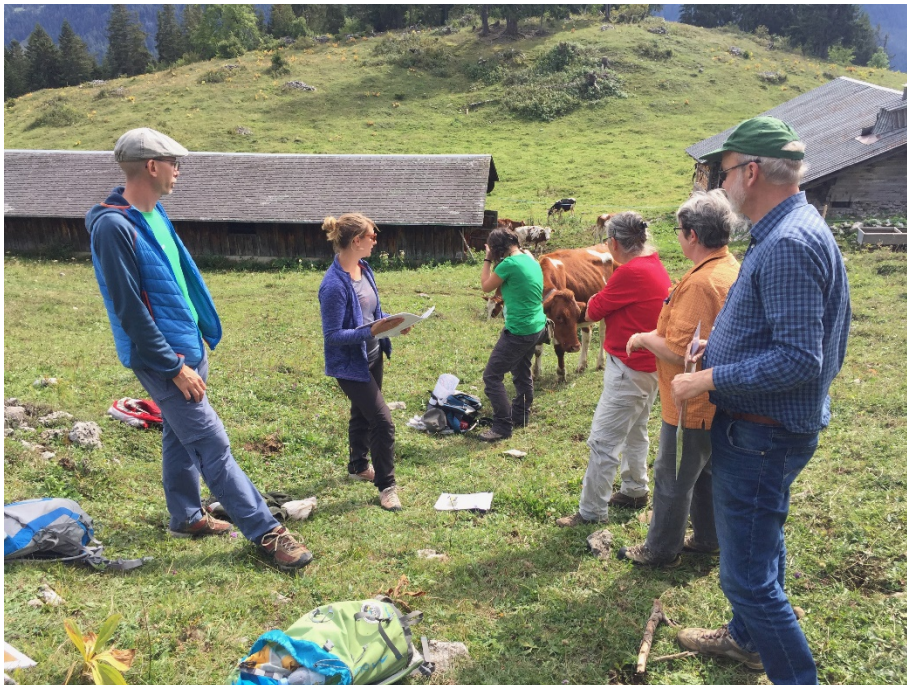
Kommentierte Besuch des Regionalparks "Gruyère - Pays d'Enhaut"