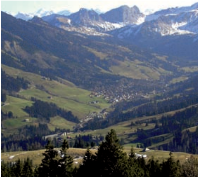
Die adaptive Bewirtschaftung von Landschaften wie z.B. des Biosphärenreservats Entlebuch dürfte zu einer Schlüssel-Herausforderung des 21. Jahrhunderts werden.

La gestion adaptative de paysages tels que l'Entlebuch, une réserve de la biosphère, pourrait devenir un défi clé du 21 e siècle.