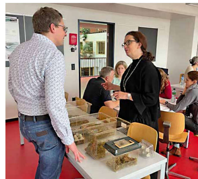
LSS 2024: atelier sur les grillons.

Dès début mars, inscrivez-vous (délai de soumission des projets le 30 septembre). Pour les Romand-es, comme le trajet est long, Science on Stage offre le voyage et la nuit à l'hôtel le soir avant le festival.