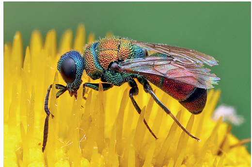
Abb. 3. Männchen der Goldwespe Chrysis cortii Linsenmaier, 1951 vom Fundort in Möhlin (Abb. 5) am 08.08.2023.