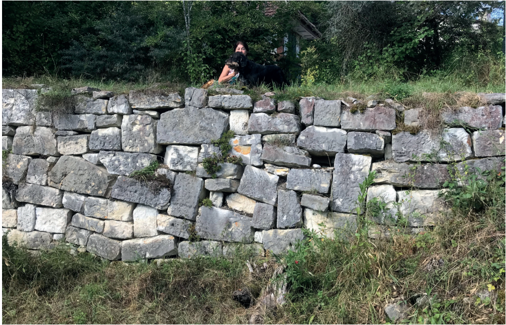
Abb. 4. Fundort von Chrysis cortii (Abb. 2) an einer südexponierten Legesteinstützmauer am Siedlungsrand von Neuhausen a. R. (SH) am 17.09.2021.