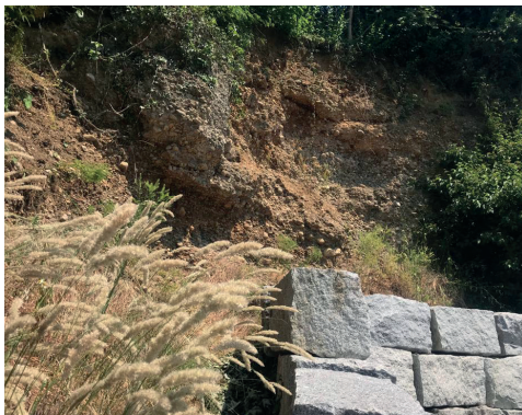
Abb. 5. Fundort von Chrysis cortii (Abb. 3) an einer südexponierten, geologisch sehr jungen Nagelfluh-Steilwand im Siedlungsraum von Möhlin (AG) am 08.08.2023.