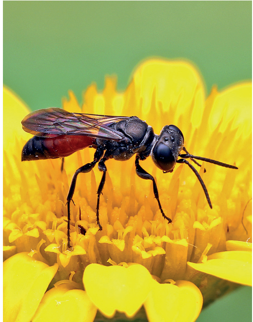
Abb. 6. Männchen der Zweifarbigen Spinnenjäger-Grabwespe Miscophus bicolor Jurine, 1807 vom Fundort in Möhlin (AG) (Abb. 5) am 08.08.2023.