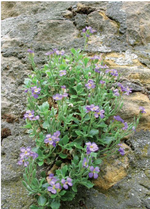
Figure 3 : Aubrieta deltoïdea (L.) DC. (Brassicacée).