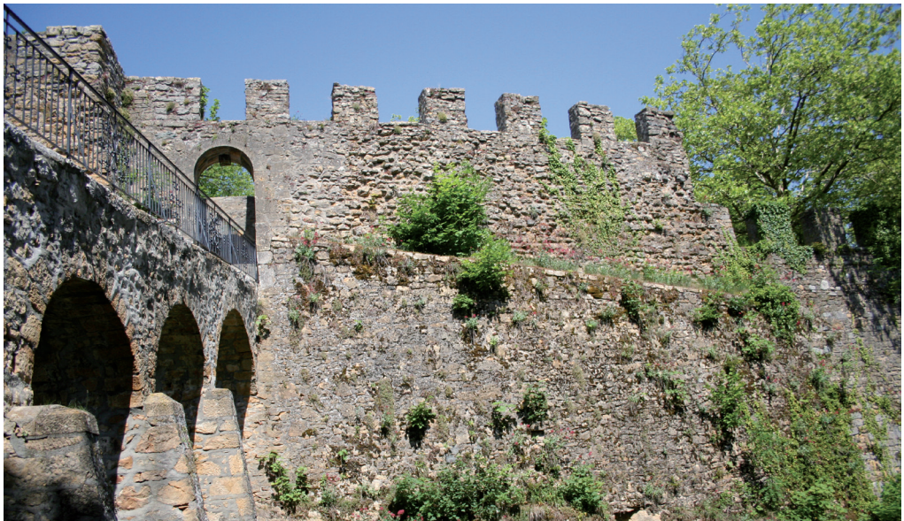
Figure 1 : Mur d'enceinte de l'esplanade du château de Neuchâtel. La partie étudiée est le grand rectangle mural au centre de l'image.