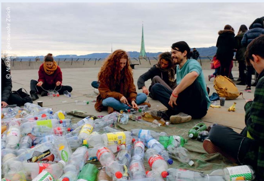
ABBILDUNG 1: Im Rahmen der Nachhaltigkeitswoche Zürich 2018 fand ein Workshop zu urban gardening auf der Polyterrasse der ETH statt. Die Studierenden konnten mit PET-Flaschen und anderen Behältern Vasen für ihre Kräuter konstruieren und mit nach Hause nehmen.