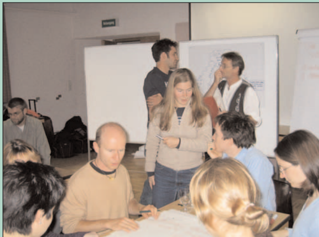
Young NCCR scientists discussing interdisciplinary project ideas at the annual PhD-Workshop

NCCR Climate's PhD-Workshop has definitely become a tradition: the third get together for all the PhD-students involved in the program took place at Gwatt center on the shores of lake Thun at the beginning of June. Some 50 young