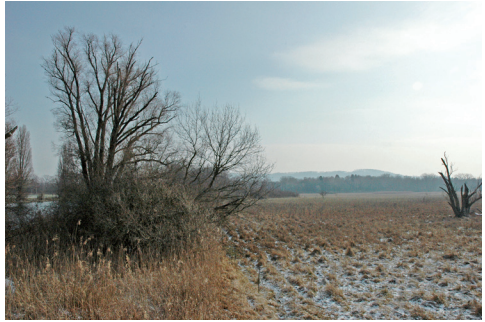
Abb. 5. Standort der Pheromonfalle im Innern des Gehölzes.