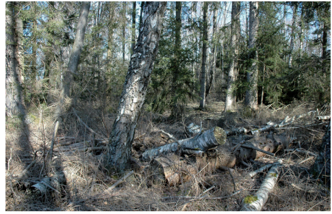
Abb. 4. Fundstelle der eingesammelten Porlinge.