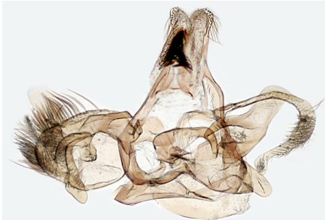
Abb. 2. D. heindeli , männliche Genitalstrukturen.