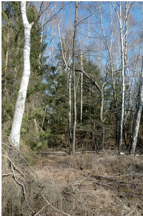
Abb. 3. Habitat: Auwald bei Cudrefin VD.