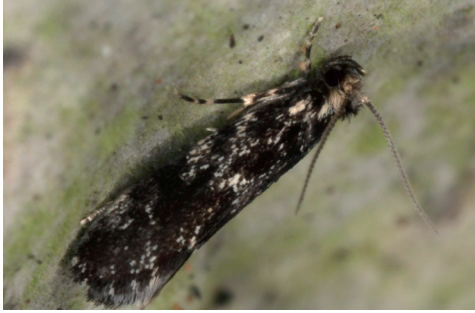
Abb. 1. D. heindeli , Männchen.