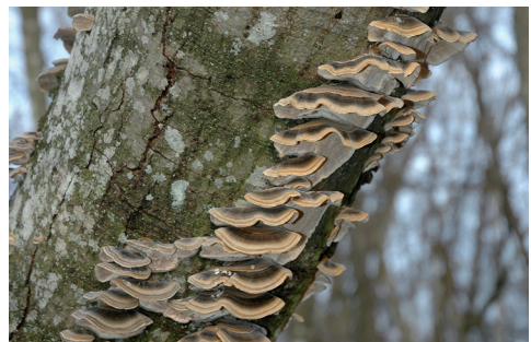
Abb. 6. Rauchgrauer Porling ( B. adusta ).