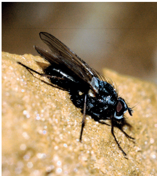
Abb. 1. Eutrichota paratunicata (Hennig, 1973) konnte aus Murmeltierkot gezüchtet werden, wodurch das Larvalhabitat nachgewiesen werden konnte. Als Alpenmurmeltiere fast ausgerottet waren, war auch diese Fliege beinahe verschwunden. In der Zwischenzeit kann man die Art an nahezu jedem Murmeltierbau finden.

Schwerpunkte in der Gegend um Adelboden waren das Engstligental von der Engstligenalp (um 1950 m ü. M.) bis zum Pochtenkessel, wo die Engstlige reissend fliesst und in einer tief eingeschnittenen Schlucht den Charakter eines Kataraktes mit Stromschnellen annimmt (1060 m ü. M.). Die subalpinen Fichtenwälder, die Viehweiden knapp unter und über der Waldgrenze mit ihren Quellsümpfen wurden ebenso besammelt wie die naturnahen Gebirgsbäche mit ihren Schotterflächen.