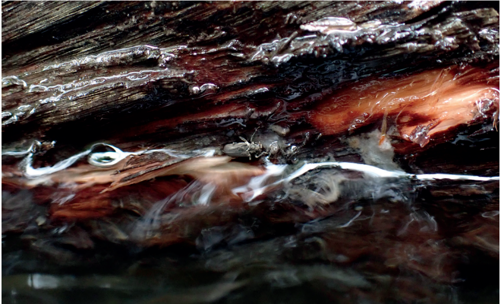
Abb. 4: In situ Aufnahme P. acuminatus an Totholz.