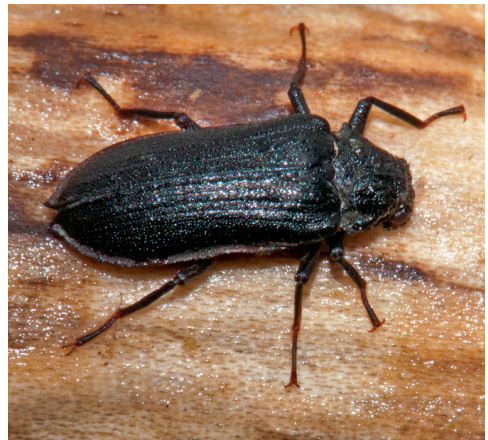
Abb. 5: Aufnahme P. acuminatus an Totholz. ( ; 21.07.2020)