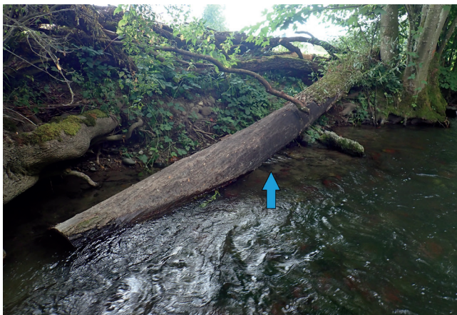
Abb. 2 und 3: Fundorte der Adulttiere P. acuminatus.