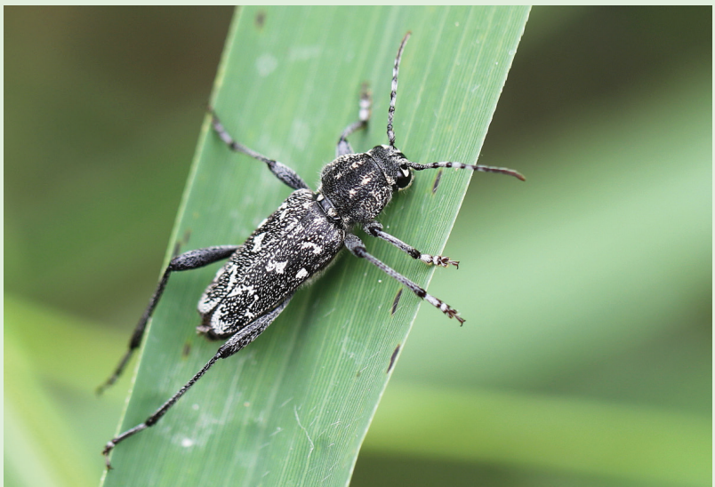
Rusticoclytus rusticus , Bois de Finges (VS).