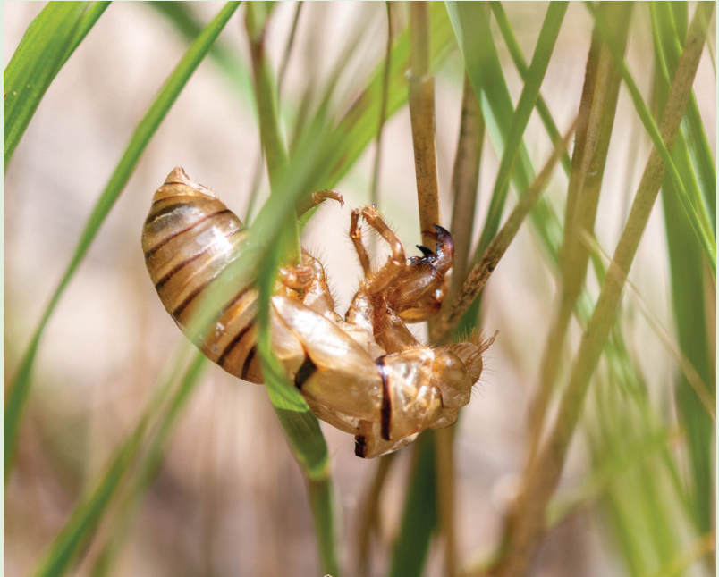
Tibicina quadrisignata , Bois de Finges (VS).