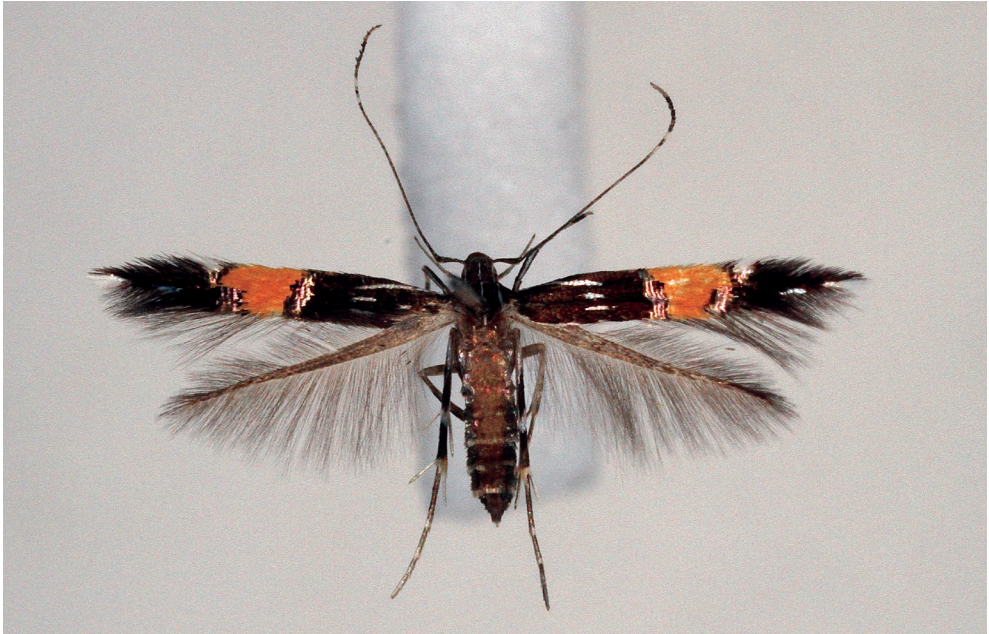
Abb. 2. Fingerhirsens-Prachtfalter Cosmopterix feminella , ♀ Präparat (Spannweite: 8 mm).

Julisch Venetien und Piemont an acht Fundorten insgesamt 58 Weibchen einer vorerst unbekanntes Cosmopterigidae (Prachtfalter) beim Lichtfang gesammelt. Koster et. al. (2019) konnten die Artzugehörigkeit klären und Cosmopterix feminella neu für Europa melden. In der gleichen Arbeit wird auch die japanische C. feminae mit C. feminella synonymisiert. Bei zwei Lichtfängen im Tessin gelangte dem Erstautor nun auch in der Schweiz der Fund von insgesamt drei Weibchen von C. feminella .