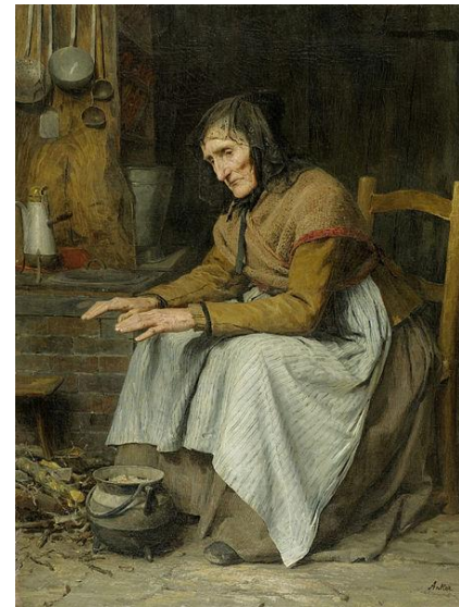
„Hohes Alter“ von Albert Anker (Öl auf Leinwand, ca. 1885)