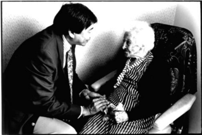
Jeanne Calment starb 1997 im Alter von 122 Jahren und 164 Tagen.