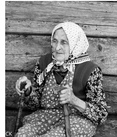
„Hohes Alter“ von Carsten Keßel (Fotografie, 2012)