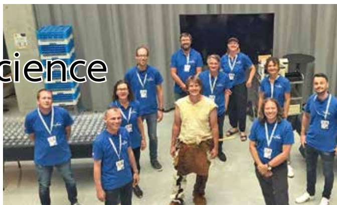
Délégation suisse à Turku 2024 (Science on Stage Switzerland).

Un marché aux idées, des échanges avec ses collègues, un spectacle pour s'en mettre plein la vue: participer à notre festival avec votre projet comme visiteuse ou visiteur. Rendez-vous le 15 novembre au Technorama.