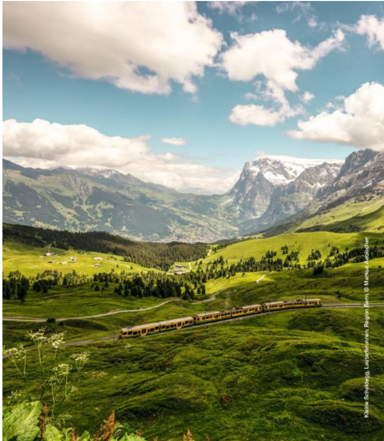
Kleine Scheidegg, Larbsbunnen, Region Bern, © Markus Aebischer