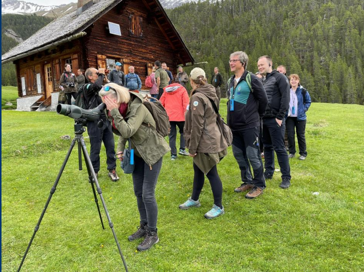
Study Trip 2025 slowakische Nationalparks in der Schweiz