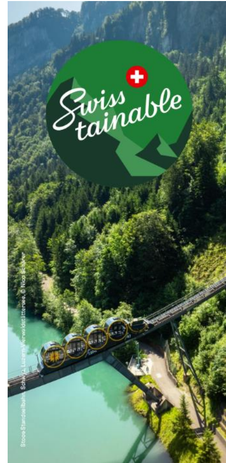
Stoos-Standardbahn, Schwyz, Luzern, Forwaldstrasse, © Nils Schärer