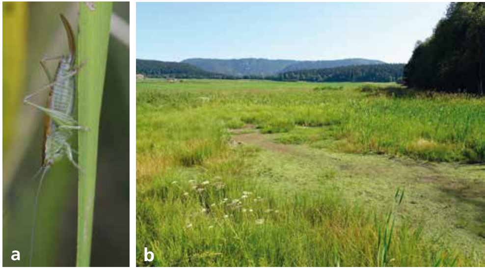
Fig. 1. a ) Femelle adulte de Conocephalus dorsalis , Bois des Lattes (NE), juillet 2018. b ) Habitat occupé par Conocephalus dorsalis au Bois des Lattes (NE), 997 m, juillet 2018.

Trois autres espèces hygrophiles composent la faune orthoptérique du site à savoir Chrysochraon dispar (Germar, 1834), Stethophyma grossum (L., 1758) et Tetrix subulata (L., 1758), alors que Conocephalus fuscus (Fabricius, 1793), Metrioptera roeselii (Hagenbach, 1822), Miramella alpina (Kollar, 1833), Polysarcus denticauda (Charpentier, 1825) et Tettigonia viridissima (L., 1758) ont été observés à l'unité ou proviennent de milieux proches.