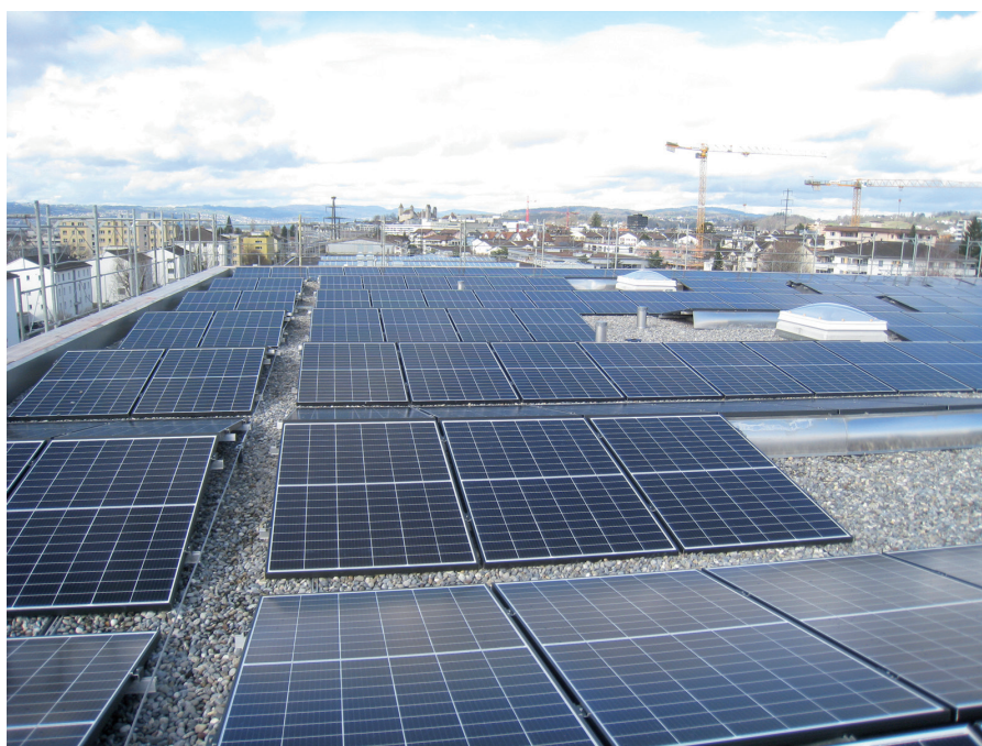
Fotovoltaik-Anlagen wie hier auf dem Dach eines Gebäudes im NefTechPark liefert erneuerbare Energie.

Zum Heizen bieten sich laut der Studie primär Wärmepumpen an. Erstens sind sie bei Neubauten, die mit verhältnismässig niedrigen Temperaturen beheizt werden können, sehr effizient. Zweitens existieren auf dem Areal Schachen diverse geeignete Niedertemperaturwärmequellen, um Wärmepumpen zu betreiben. Die Autorinnen und Autoren verglichen dabei Grundwasser, Erdwärme, Seewasser des nahegelegenen Obersees und die