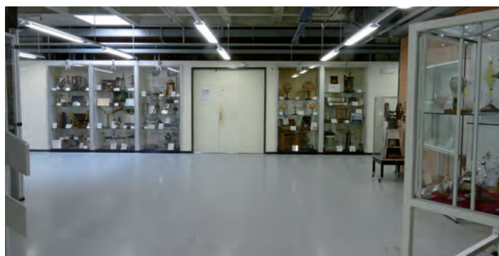
Fig. 2: Vue d'une partie des vitrines du Musée

Tel est le cas des instruments exposés au Musée de la Physique de l'UNIL. Il est par exemple intéressant de noter que la spectroscopie optique instrumentale a précédé de près d'un siècle l'arrivée de la physique quantique. Des spectros-