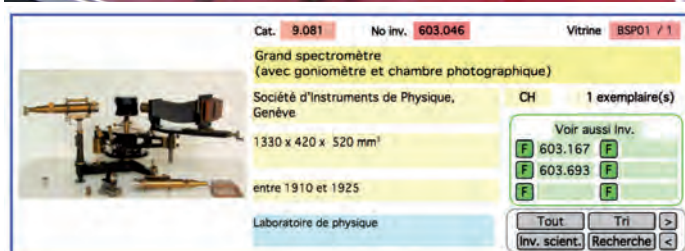
Fig. 1: Exemple d'objets conservés et de sa fiche d'inventaire sommaire

Catalogue SIP (en français 1912 et en anglais 1913):