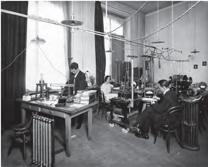
Fig. 5: Travaux pratiques à l'école de physique en 1923, on y reconnaît nombre d'appareils exposés

Le musée contient des instruments fabriqués et utilisés sur une période de plus de trois siècles : les plus anciens datent de la fin du XVIII ème siècle. Il a été décidé, arbitrairement, de n'exposer que des objets vieux de plus de 50 ans.