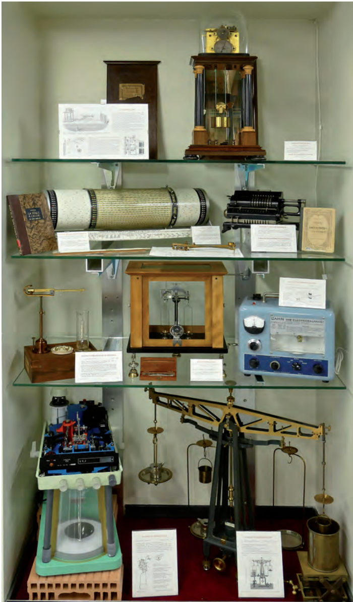
Fig. 3: Vitrine n.14, de haut en bas et de gauche à droite : chronoscope Hipp (Neuchâtel, 1886); rouleau à calcul Loga (Uster, ZH, 2e quart XXe s.); planimètre Amsler (Schaffhouse, 1867); machine à calculer Facit (Suède, ~1925); balance de Westphal (Celle, D, 1881); balance analytique (August Sauter, Ebingen, Württemberg, début 20e s.); balance de torsion électrique Cahn (Ca, US, 1970); balance de substitution de Mettler Typ S6 (Greifensee, ZH, 1965); balance de démonstration (Rueprecht, Wien, fin XIXe s.)

copies très perfectionnés, comme celui de la Fig. 1, ont été utilisés pour identifier les éléments chimiques sur Terre et dans les étoiles bien avant que l'hypothèse atomique ne soit acceptée sans réserve et qu'on sache mettre en relation la position des raies avec la structure des atomes. Mais le musée, par l'ensemble de sa collection, n'évoque pas seulement l'histoire de la physique et de la recherche. Il nous