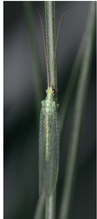
Abb. 2. Cunctochrysa cosmia in Tarnstellung.

Die drei Cunctochrysa -Arten lassen sich morphologisch vor allem anhand der Flügelgrösse und der Flügeladern im Costalfeld unterscheiden. Dobosz & Jungkiert (2018) geben noch weitere Unterscheidungsmerkmale an. Die Vorderflügelänge ist bei den Weibchen von C. albolineata mit 12–14 mm am grössten, gefolgt von C. cosmia mit 10–13 mm. C. baetica , die am ehesten mit C. albolineata verwechselt werden kann, ist mit einer Flügellänge der Weibchen von nur 9–11 mm signifikant kleiner. Auch bei den Männchen