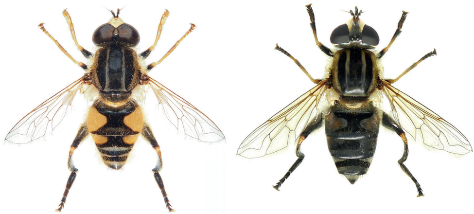
Fig. 3. Mesembrius peregrinus , habitus du mâle (à gauche) et de la femelle (à droite), taille 10,5–14 mm.