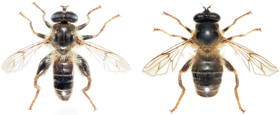
Fig. 2. Criorhina pachymera , habitus du mâle (à gauche) et de la femelle (à droite), taille 12–18,5 mm.

à cause d'une confusion possible avec une forme particulière de Criorhina ranunculi (Panzer, 1804) qui vient d'être découverte en Suisse (Speight et al. 2020). Les principaux ouvrages de détermination ne prenant pas en compte cette forme rare de C. ranunculi , une clé a été élaborée par Speight et al. (2020). L'observation de C. pachymera dans deux localités composées de forêts riveraines mixtes, classées comme zones alluviales d'importance nationale depuis 1992, témoigne de la nécessité de préserver ces habitats pour la conservation d'espèces menacées.