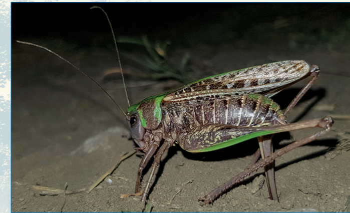
Abb. 6: Weibchen bei der Eiablage.

Nymphen. Diese haben einen hohen Wärmeanspruch und sind deshalb auf eine hohe Sonneneinstrahlung angewiesen. Nach dem Schlupf bevorzugen die Jungtiere eine höhere Vegetation, denn hier sind sie besser vor Fressfeinden geschützt. Trotzdem ist ihre Sterblichkeit sehr hoch, und nur wenige Nymphen entwickeln sich erfolgreich bis zum adulten Tier. Diese treten von Mitte Juni bis Anfang Oktober auf; am häufigsten sind sie im August zu finden. Decticus verrucivorus ernährt sich vorwiegend von anderen Insekten. Die Art gilt besonders in seinen Jungstadien als räuberisch. Die ausgewachsenen Tiere nehmen jedoch auch pflanzliche Nahrung zu sich.