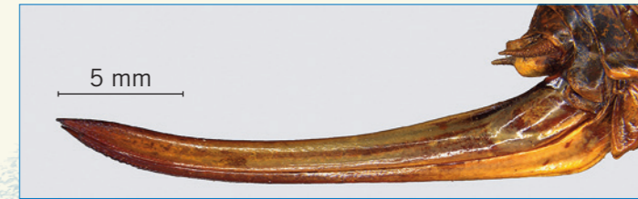
Abb. 5: Der Eiablageapparat des Weibchens (Ovipositor).

Der Lebenszyklus von Decticus verrucivorus ist ein wahres Wunder. Die Art gilt als univoltin (eine Generation pro Jahr). Die Paarung erfolgt im Spätsommer. Die erwachsenen Weibchen legen nach der Paarung im Herbst Eipakete von meist vier Eiern ab. Sie stecken hierfür ihren ca. zwei Zentimeter langen Legebohrer (Abb. 5) in feuchten und eher offenen Boden (Abb. 6). Insgesamt werden so schätzungsweise 200 bis 300 Eier abgelegt, die bis zu sieben Jahre im Boden verweilen können, bevor die Embryonalentwicklung einsetzt. In der Regel kommt es erst zwei Jahre nach der Eiablage Mitte April zum Schlupf der