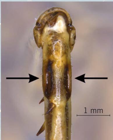
Abb. 8: Das „Ohr“ des Warzenbeißers (Tympanalorgan).

Wer singt, sollte auch hören können. Deshalb haben Langfüßlerheuschrecken ein faszinierendes Hörorgan. Dieses sogenannte Tympanalorgan befindet sich unterhalb des Knies der Vorderbeine (Abb. 8). Es ähnelt dem menschlichen Trommelfell. Durch eine verdünnte Stelle der Außenhaut (Cuticula), die mit speziellen Rezeptoren ausgestattet ist, kann Schall wahrgenommen werden. Möglich sind somit Ortungshören (sowohl die Richtung als auch die Entfernung) als auch die Erkennung der männlichen Lock- oder „Stör“-rufe.