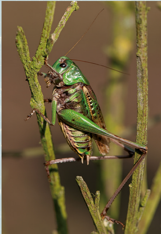
Abb. 1: Männlicher Warzenbeißer.

Mit einer Körperlänge von oft über drei, zuweilen sogar vier Zentimetern ist der Warzenbeißer eine der größten und markantesten Langfühlerheuschrecken Mitteleuropas. Der Körper der Tiere ist recht bullig mit breitem Kopf, kräftigem Halsschild und verhältnismäßig kurzen Flügeln. Wie alle Langfühlerheuschrecken besitzt der Warzenbeißer lange dünne Fühler. Die Flügelspitzen überragen knapp den Hinterleib, nicht jedoch die Knie der Hinterbeine (Abb. 1). Der Warzenbeißer ist zwar flugfähig, scheint davon jedoch kaum Gebrauch zu machen. Langstreckenflüge sind bei ihm eher selten zu beobachten. Aber die langen Sprungbeine ermöglichen weite Sprünge und, zumindest theoretisch, eine schnelle Flucht. Zumeist lässt sich der Warzenbeißer bei Gefahr jedoch einfach von der Vegetation zu Boden fallen.