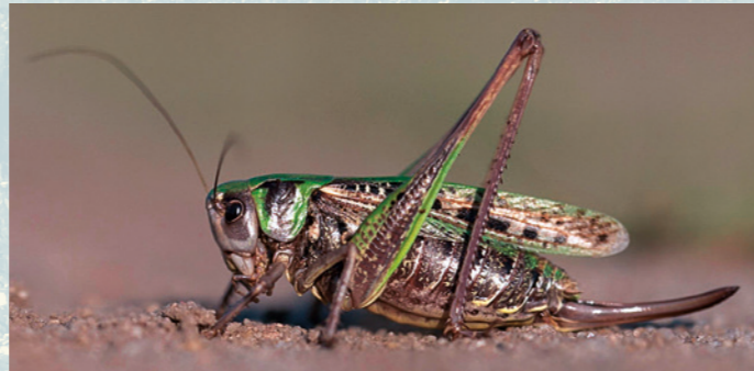
Abb. 3: Weiblicher Warzenbeißer mit langem Legebohrer.

Die Färbung der Tiere ist ausnehmend variabel, von fast rein grün bis überwiegend braun (Abb. 2). Das würfelartige Muster auf den Vorderflügeln gilt als markantes Bestimmungsmerkmal der Art. Am häufigsten werden Individuen mit grüner Grundfärbung und braunen Zeichnungselementen gefunden. Die beiden Geschlechter sind sich sehr ähnlich. Im Gegensatz zu den Männchen besitzen die Weibchen jedoch einen langen, leicht säbelartig gebogenen Legebohrer (Abb. 3). Mit diesem legen sie die Eier in den Boden ab.