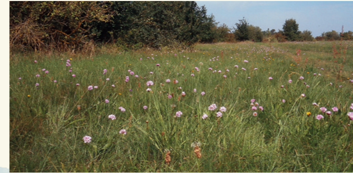
Abb. 4: Magere Wiesen und Weiden sind typische Lebensräume des Warzenbeißers – Sandmagerrasen an der Havel (Brandenburg).

In Ostdeutschland besiedelt der Warzenbeißer bevorzugt sandige Gebiete und Moore. Recht selten wird er in Nordwest-Deutschland angetroffen. In der Schweiz und Österreich gilt er aktuell zwar als weit verbreitet, ist jedoch stark im Rückgang begriffen. Daher ist er dort weitgehend isoliert in Schutzgebieten zu finden.